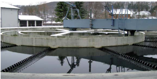
Abb. 2 Sedimentationsbecken (ehemaliger Cyclator)

Bestandteil der für den Vollstrom ausgelegten AFF-Anlage ist zudem der Sandfilter, welcher zum damaligen Zeitpunkt neu errichtet werden musste. Ausgeführt ist dieser als Zweischichtfilter mit Stützschiicht (0,25 m Kies, 0,60 m Quarzsand, 0,90 m Hydroanthrazit).