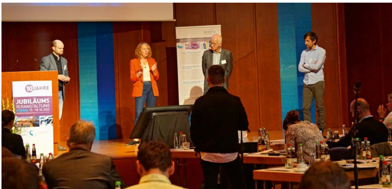
Podiumsdiskussion auf der Fachtagung im Oktober 2022

stoffe sind Stoffe anthropogener Herkunft, die meist in sehr geringen Konzentrationen in Gewässern vorkommen. Spurenstoffe stammen aus unterschiedlichen Produkten wie zum Beispiel Human- und Tierarzneimittel, Bioziden, Pflanzenschutzmitteln, Industriechemikalien oder Körperpflege- und Waschmitteln und finden in unterschiedlichen Bereichen Anwendung bzw. erfüllen hier einen Nutzen.“ Und weiter: „Relevante Spurenstoffe sind solche Stoffe, die in sehr niedrigen Konzentrationen nachteilige Wirkungen auf die aquatischen Ökosysteme haben können und/oder die Gewinnung von Trinkwasser aus dem Rohwasser negativ beeinflussen können. Zu berücksichtigen sind dabei auch Wechselwirkungen zwischen unterschiedlichen Spurenstoffen.“ Wobei Eisenträger insbesondere auf Konsens-Sprachregelungen wie „können“ und „Wechselwirkungen“ hinwies.