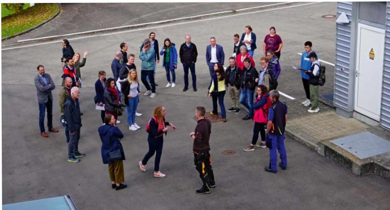
Fachexkursion zur Ozonanlage Friedrichshafen

kapazität im Land. Die Elimination wird zu 90,8 Prozent (16 Anlagen) mit Pulveraktivkohle (PAK) durchgeführt, zu 7,2 Prozent (3 Anlagen) mit Ozon und zu 2 Prozent (6 Anlagen) mit Granulierter Aktivkohle (GAK). 27 weitere Anlagen sind in Planung oder Bau.